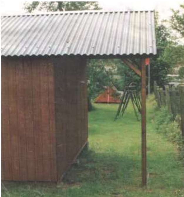
Chalet avec abri-bûches arrière sur piliers droits