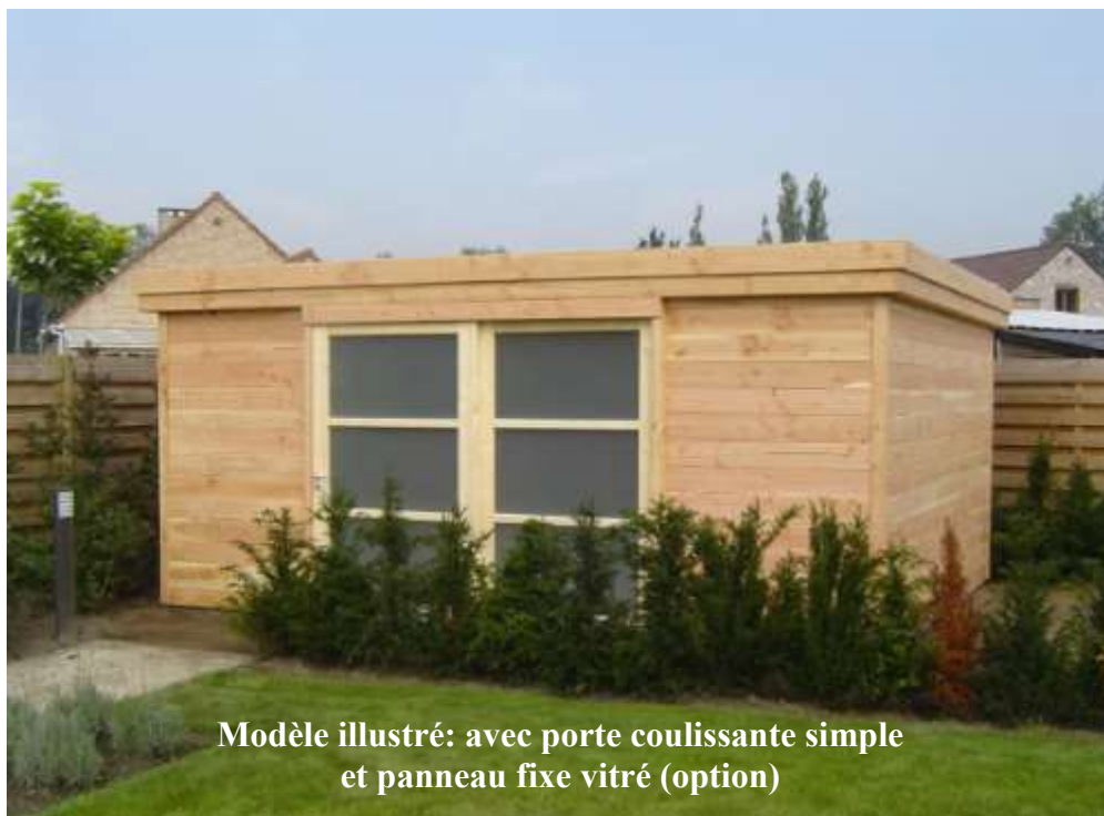
Modèle illustré: avec porte coulissante simple et panneau fixe vitré (option)