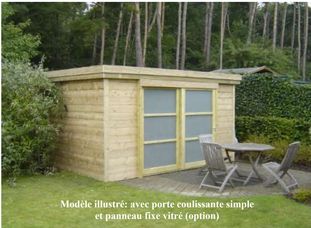
Modèle illustré: avec porte coulissante simple et panneau fixe vitré (option)