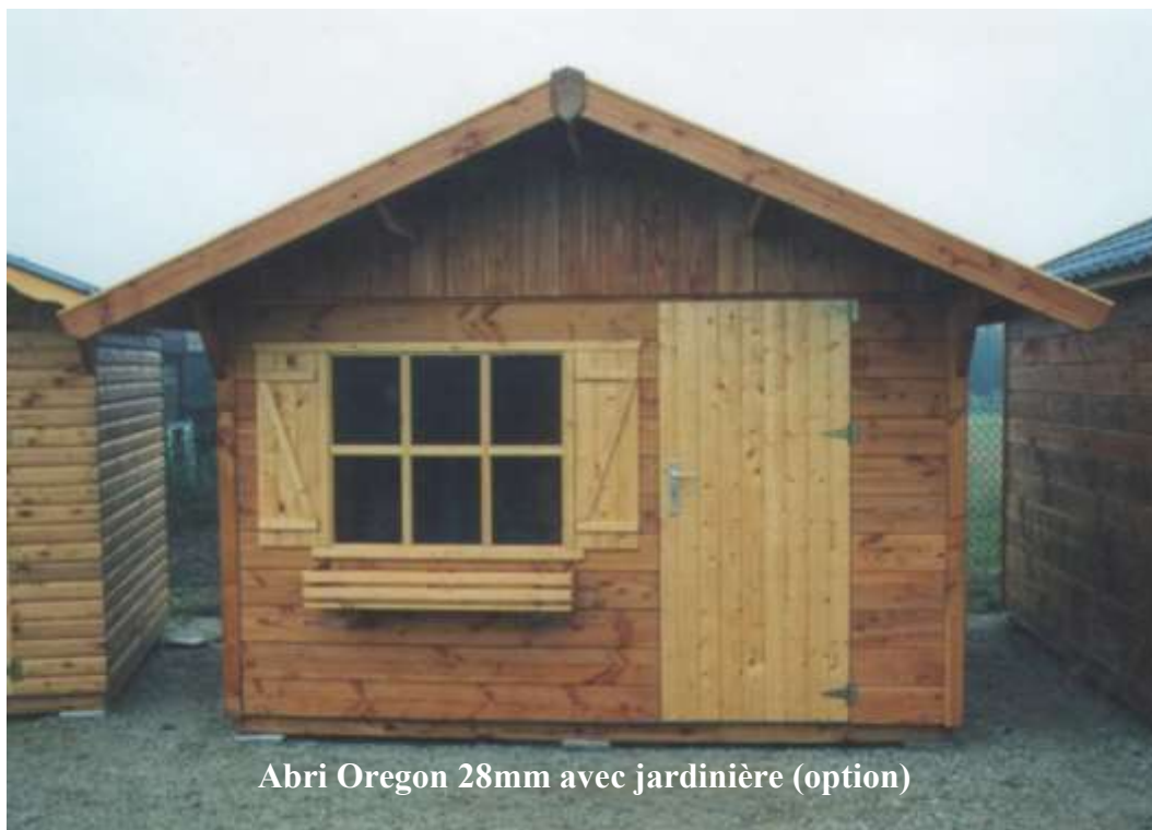
Abri Oregon 28mm avec jardinière (option)