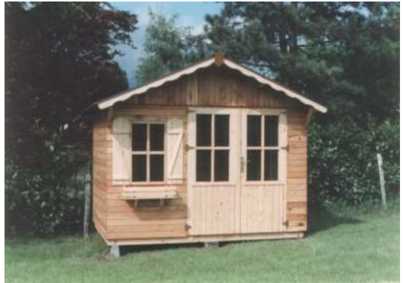
Chalet avec double porte vitrée