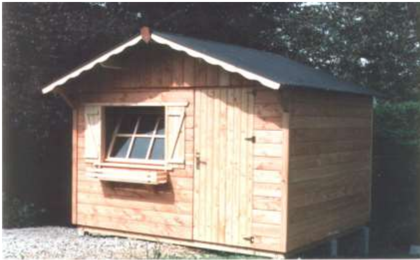
Chalet avec fenêtre basculante